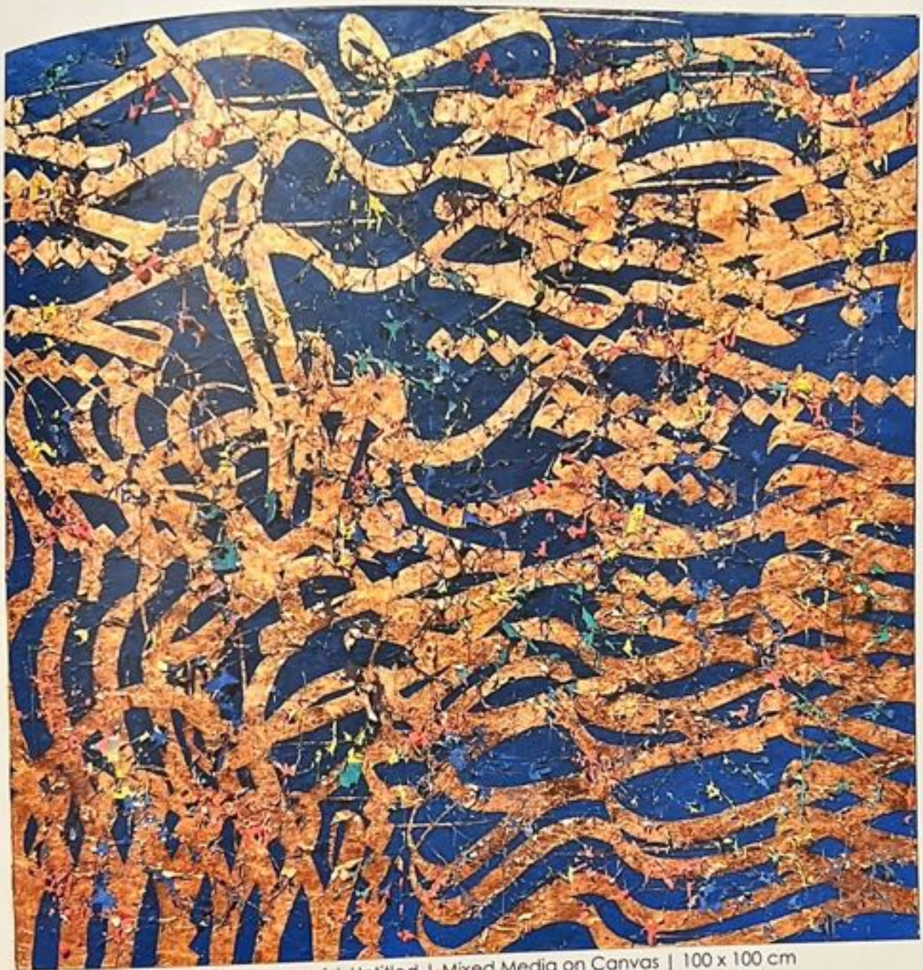
Mohammad Bozorgi | Untitled | Mixed Media on Canvas | 100 x 100 cm