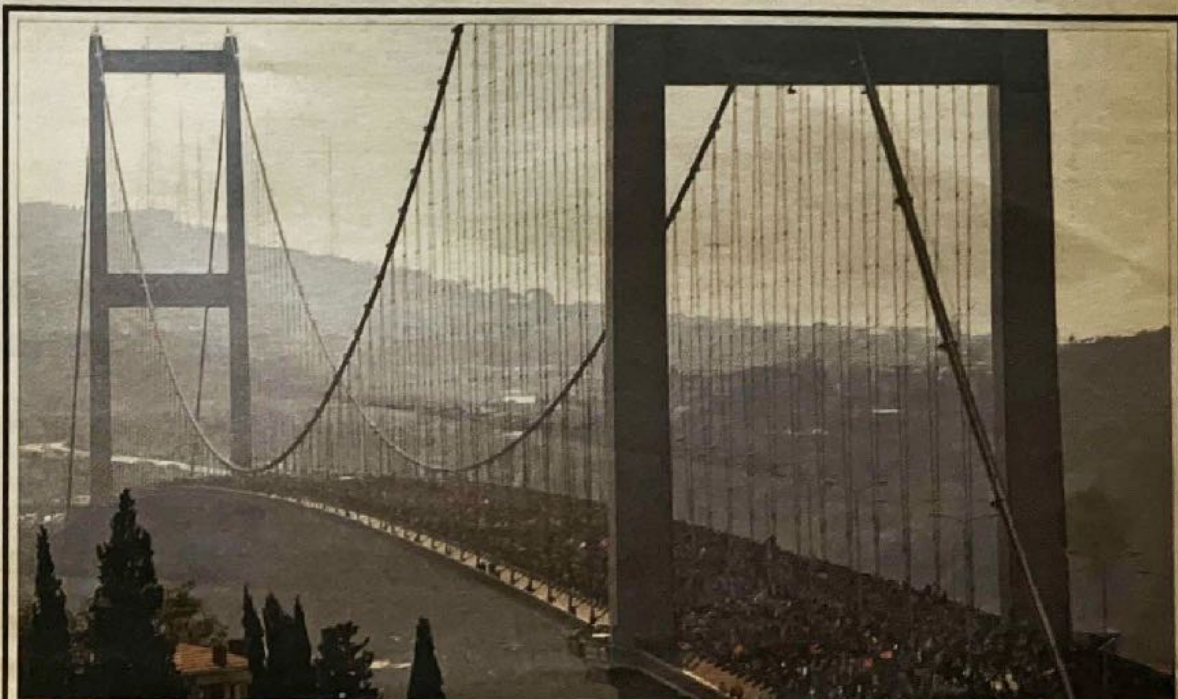
ماراتن دو قاره‌ای اروپا و آسیا در شهر استانبول ترکیه به هم متصل می‌گردد. میران سی و دومین دوره رقابت‌های ماراتن آسیا - اروپا بود. این مسابقه از بخش آسیای استانبول آغاز شد و در بخش